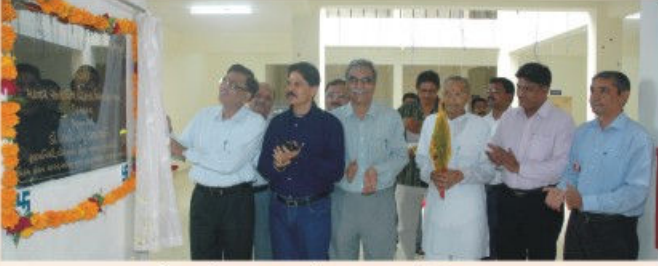
( એમ.એચ.આર.ડી. ભવનનું ઉદ્ઘાટન )